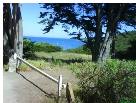
L'accès à la plage