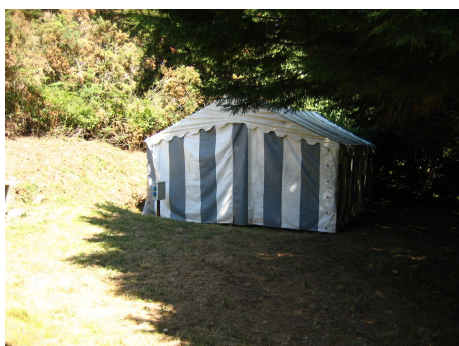
La tente marabout