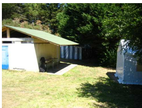
Le bloc sanitaire