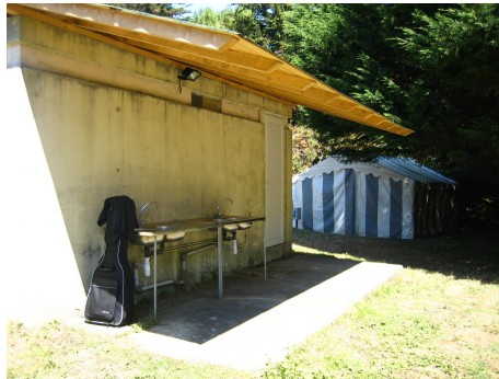
La partie vaisselle